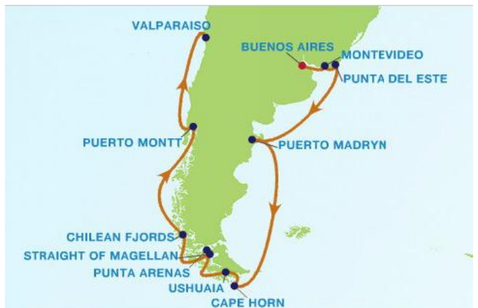
Ruta por el Cabo de Hornos

Supimos algunas cosas durante la reunión. Hay unos trescientos lectores activos en Santiago, y seis grupos de estudio. Los libros son caros. La edición en tapa blanda se vende por unos 70-80 $ EEUU. El grupo insistió en los