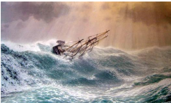
"Somético a duras pruebas", el HMS Beagle saliendo del Cabo de Hornos, 12 de enero de 1833, de John Chancellor.

4) Se necesita un apoyo continuo para los esfuerzos de diseminación de individuos y de organizaciones como el Canal de Luz, que envía cajas de libros a lectores y grupos de estudio de Latinoamérica.