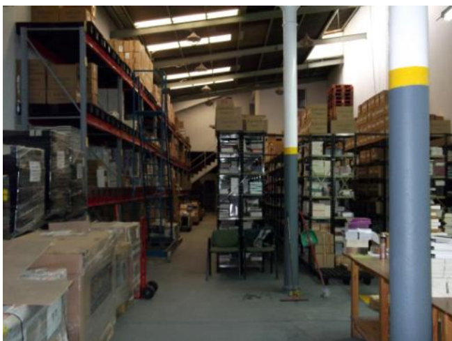
Almacén del distribuidor en Argentina.