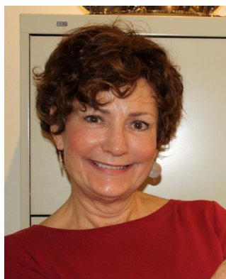
Par Joanne Strobel, Fondation Urantia, Illinois, États-Unis

La Fondation Urantia a offert des téléchargements électroniques gratuits du Livre d'Urantia et de ses traductions depuis près de huit ans, depuis 2010. La raison principale de les offrir gratuitement est notre engagement de dissémination. Dans l'Article II de la Déclaration de Fiducie de la Fondation , il est dit que :