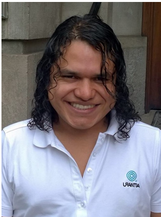
Par Antonio Schaefer, Heerlen, Pays-Bas

L'Association Urantia Internationale des Pays-Bas, vous invite à venir en Europe, au début du printemps 2018. Du 12 au 15 avril, l'Association Urantia Internationale organise sa dixième conférence internationale dans le merveilleux paysage des champs de fleurs, près