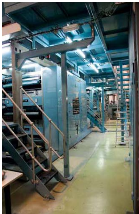
La presse Simson en bas