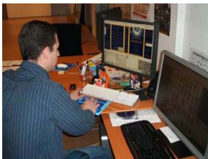
Opérations pré-impression et flashage des plaques