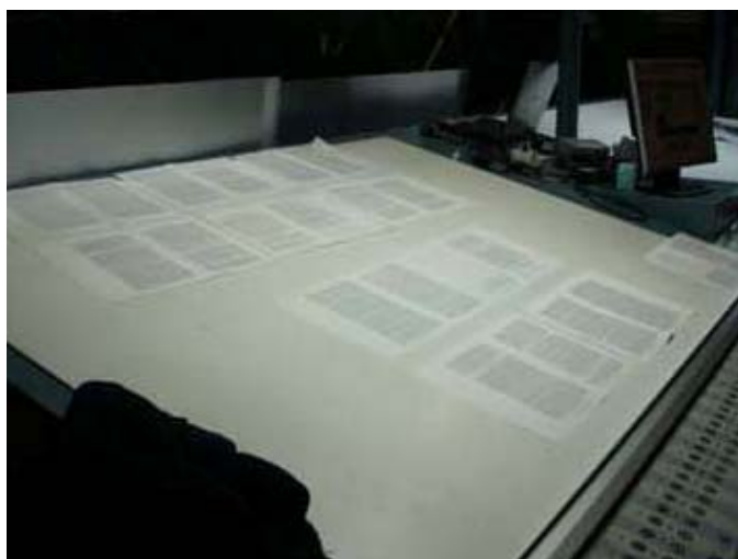
Préparation et contrôle des premières pages