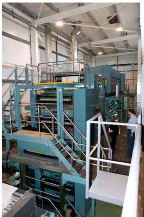
La presse Simson en haut