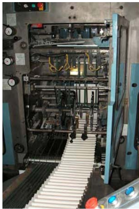
Les feuillets sont préparés pour la machine à relier