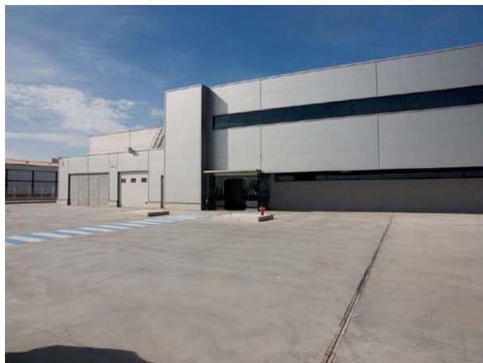
L'usine d'impression de Rotabook

Note des rédactrices : le Trustee, Georges Michelson-Dupont, nous a fourni des photos de l'impression du nouveau El libro de Urantia Édition Européenne , qui est vendu en Espagne. L'édition de 1993 du El libro de Urantia est actuellement en révision par une équipe de lecteurs, qui espèrent la finir rapidement.