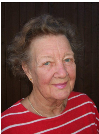
Par Irmeli Sjölie, Trustee Associé, Helsinki, Finlande

Note de la Rédactrice : Durant six jours et sept nuits, du 3 au 5 décembre 2009, le Parlement à Melbourne a reçu plus de 6500 personnes représentant plus de 200 traditions religieuses et spirituelles venant de plus de 80 pays. Les participants avaient le choix entre plus de 550 programmes, qui comprenaient des célébrations journalières, des inter et intra programmes religieux, des symposiums, des