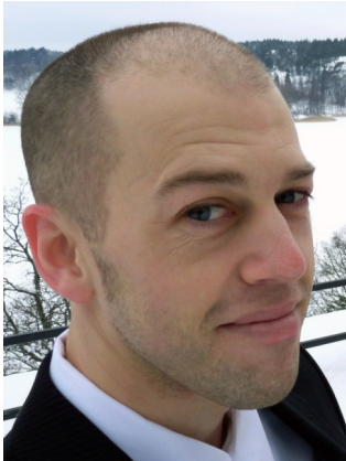
Par Jacob D, Stockholm, Suède

Demandez à quiconque vivant en Suède, et il sera d'accord avec les statistiques montrant que la Suède est le pays le plus athée de la planète. C'est la capitale séculière du monde, et je veux dire par "séculière" "une vie sans la présence de Dieu". Dieu a été banni de la vie quotidienne. Certains hommes publics de Suède clament même que la religion est un aspect mourant de l'âge de la superstition de l'humanité, que la religion est presque sortie de cette société humaniste idéale et le bourdonnement journalier de dénigrement de la religion est incessant dans les articles de journaux. En fait, le peuple suédois a vécu si longtemps sans religion en tant que sujet d'honnête discussion que le langage s'est atrophié et