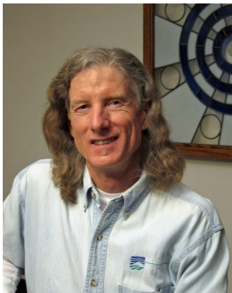
Par James Woodward, Illinois, États-Unis

Ma participation au Parlement des Religions du Monde à Melbourne, à la fin de l'année dernière, a eu un impact inattendu sur moi de différentes manières. C'était ma première grande aventure internationale, bien que j'avais entendu de merveilleux comptes rendus inspirants par des lecteurs du Livre d'Urantia qui avaient participé aux Parlements précédents. Le fait de vivre à Chicago où se trouve le siège principal de l'organisation caritative, me donna la possibilité de participer aux événements précédents du Parlement, en ayant un avant goût qui n'avait rien à voir avec la réalité d'être au grand événement qui se passe tous les cinq ans. Pour plus d'information, vous pouvez visiter : www.parliamentofreligions.org