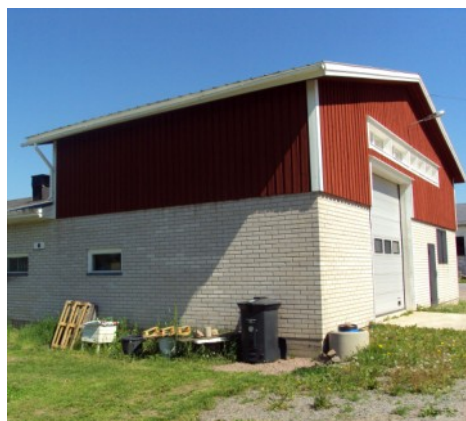
Entrepôt du livre finnois

dance, je portais un toast à Joel et le remerciais pour son travail sur la traduction suédoise ainsi que pour tous ses efforts depuis 1966 pour propager les enseignements du Livre d'Urantia en Finlande.