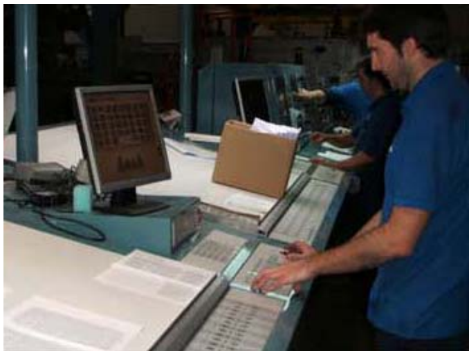
Preparación y comprobación de las primeras páginas