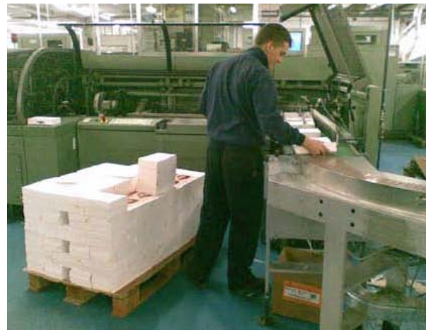
Empaquetando los libros para su distribución