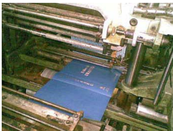
Operación de encuadernación